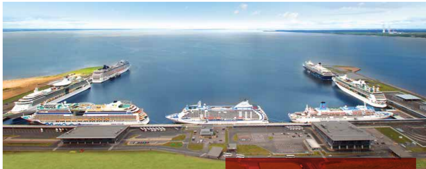
СХЕМА ПАССАЖИРСКОГО ПОРТА САНКТ-ПЕТЕРБУРГ